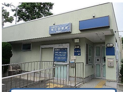
うめがおかとしょかんかりじむしょ 梅丘図書館仮事務所